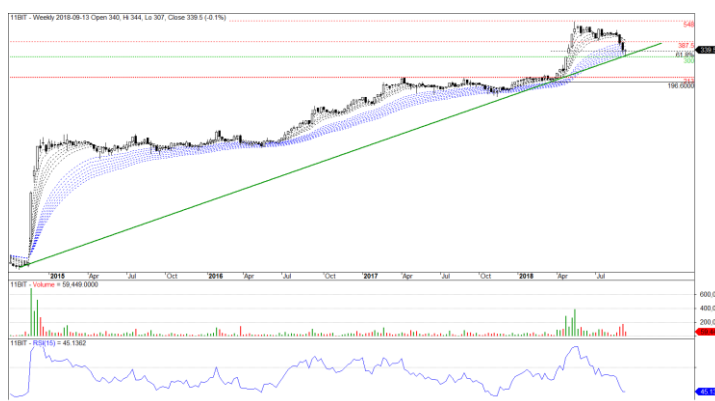
Wykres 2. Wykres tygodniowy świecowy nieuwzględniający prawa z akcji.

Papier ma za sobą mocniejszą korektę, która przybrała zarówno cechy struktury horzontalnej jak i wertykalnej. Na uwagę zasługuje zachowanie się wolumenu, mianowicie trwające od kilku tygodni spadki wytraciły zarówno na impecie jak i natężeniu. Prawdopodobnie jest to związane z dotarciem cen do strefy wsparcia, na którą składają się linia trendu, dzienna dwusetka, tygodniowe EMA oraz zniesienie Fibonacciego 61.8%. Wszystko to pozytywnie oddziałuje na kurs zatem od strony technicznej papier jest w takim miejscu, w którym ma prawo dojść do zainicjowania kolejnej fali zwyżki. Nie można jednak zapomnieć, że w przypadku negatywnego triggera ww. strefa wsparcia może zostać przełamana generując średnioterminowy sygnał sprzedaży z zasięgiem w stronę 222PLN, jednakże dopóki dzienne close wypadła powyżej 300PLN, dopóty kreski przemawiają na korzyść odbicia i aprecjacji.