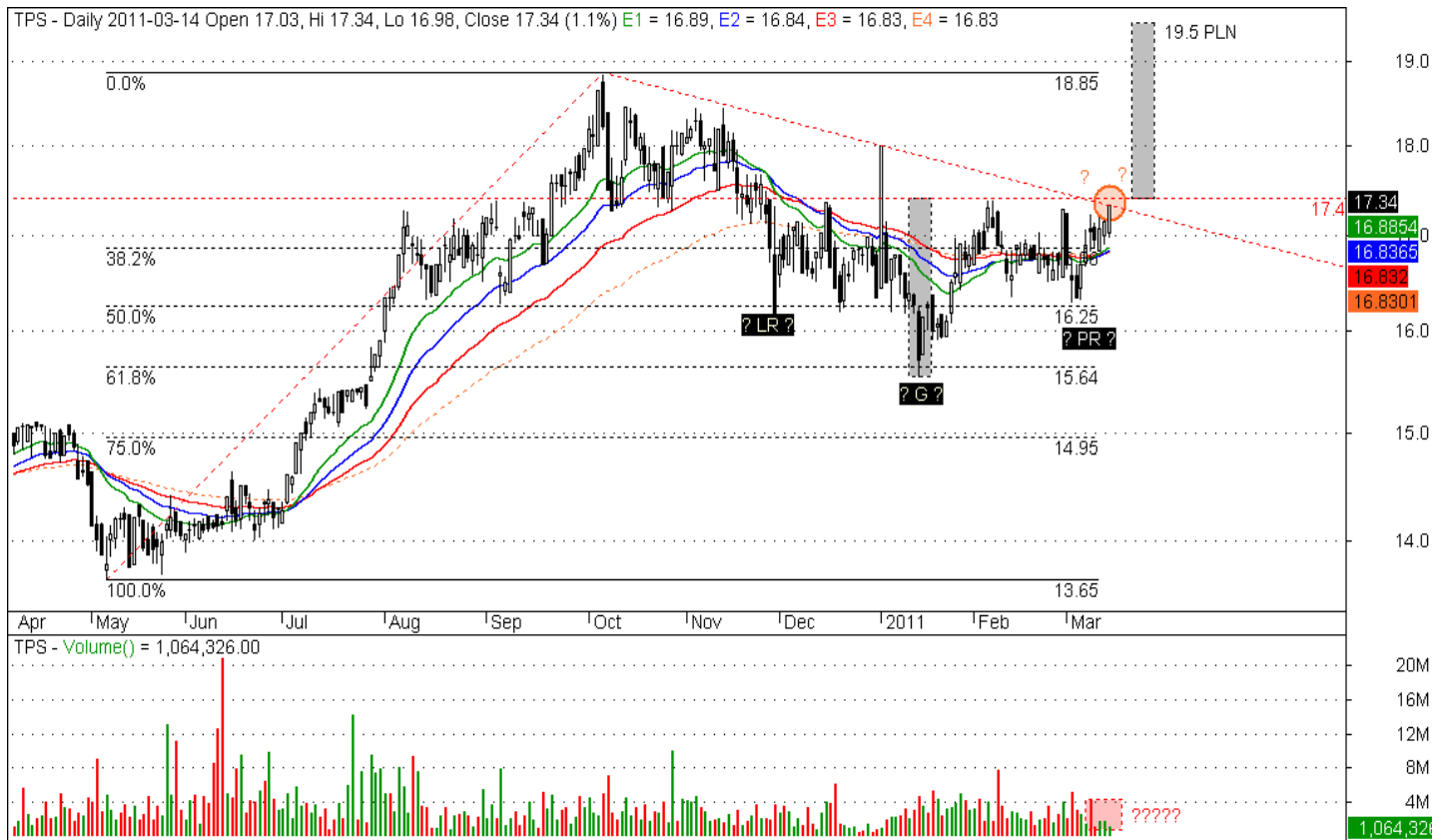
Rys. nr 1. TPSA Wykres dzienny świecowy.

Niniejsza publikacja jest publikacją handlową, prosimy o zapoznanie się z oświadczeniem umieszczonym na jej końcu.