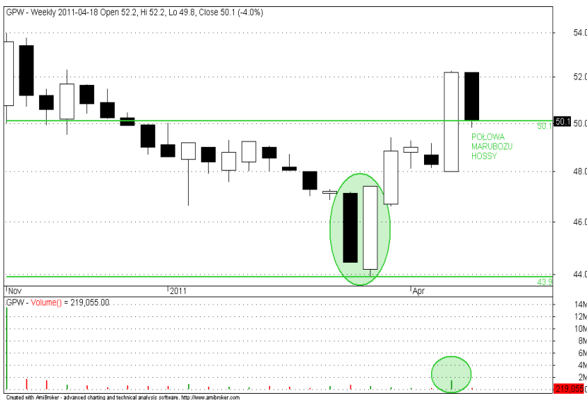
Rys. nr 2. GPW Wykres tygodniowy świecowy.

Wczorajsze zawirowania na GPW wynikające z czynników zewnętrznych stworzyły wiele ciekawych okazji. Do jednej z nich należy GPW a mianowicie od strony technicznej miała miejsce korekta do linii szyi odwróconej formacji G&R, której zasięg wskazuje na strefę 56 PLN. Korekta ta odbyła się na mniejszym wolumenie niż średnia z ostatnich pięciu dni akumulacji, a poniedziałkowy close 50.1 PLN wypadł w połowie białego tygodniowego marubozu. Może zbyt dużo tych książkowych powiązań z wczorajszymi wydarzeniami, jednakże wciąż układ EMA jest byczy, trend pozostał wzrostowy a potencjał aprecjacji znacznie się zwiększył. Poziom stop tym razem wyjątkowo można nieco obniżyć do poziomu wypadającego tuż poniżej dna zeszlotygodniowej białej świeczki czyli na 47.95 PLN close.