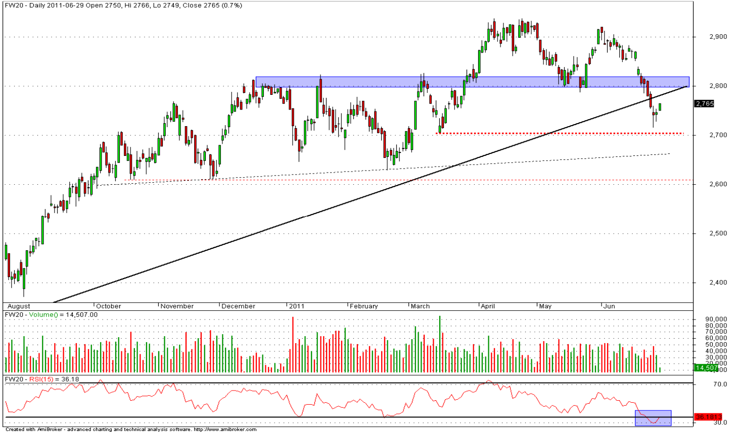
Rys. nr 1. FW20 Wykres dzienny świecowy.

Niniejsza publikacja jest publikacją handlową, prosimy o zapoznanie się z oświadczeniem umieszczonym na jej końcu.