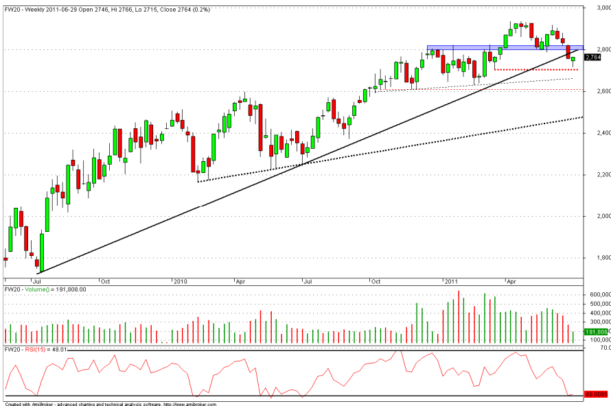
Rys. nr 2. FW20 Wykres tygodniowy świecowy.

Po dwóch szpulkach dziś popyt zdecydował się na mocniejszy ruch korekcyjny. Pierwszym poważnym argumentem dla byków będzie zamknięcie dnia powyżej poziomu 2800 pkt. na Wig20 (ok. 2760 pkt. na kontrakcie). O zmianie tendencji na wzrostową będzie można mówić dopiero po powrocie cen kontraktów powyżej 2800 pkt.