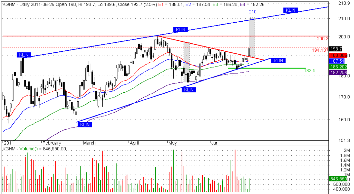
Rys. nr 1. KGHM Wykres dzienny świecowy

Niniejsza publikacja jest publikacją handlową, prosimy o zapoznanie się z oświadczeniem umieszczonym na jej końcu.