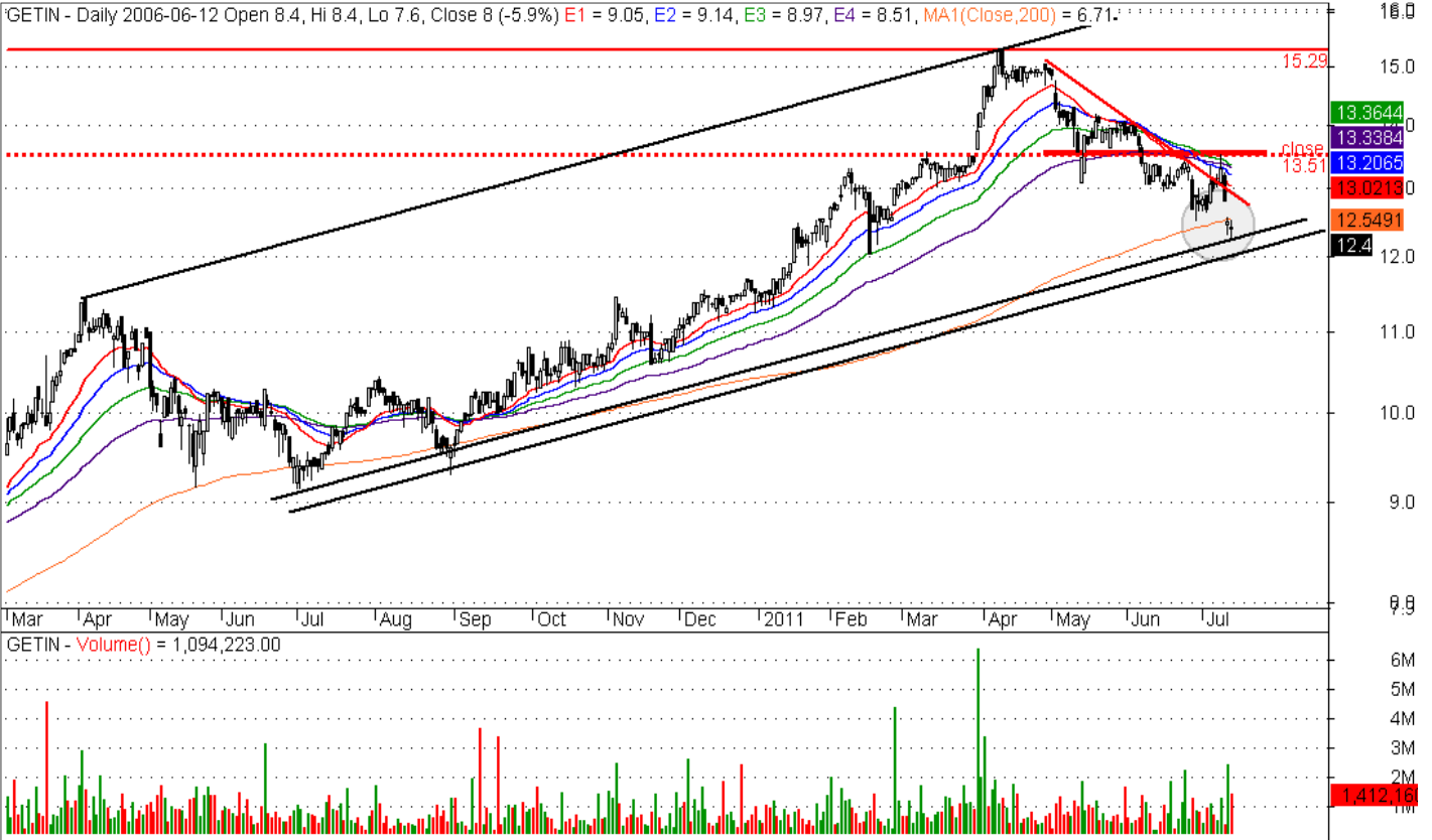
Rys. nr 1. GETIN Wykres dzienny świecowy

Niniejsza publikacja jest publikacją handlową, prosimy o zapoznanie się z oświadczeniem umieszczonym na jej końcu.