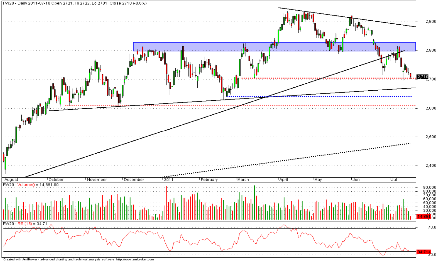
Rys. nr 1. FW20 Wykres dzienny świecowy.

Niniejsza publikacja jest publikacją handlową, prosimy o zapoznanie się z oświadczeniem umieszczonym na jej końcu.