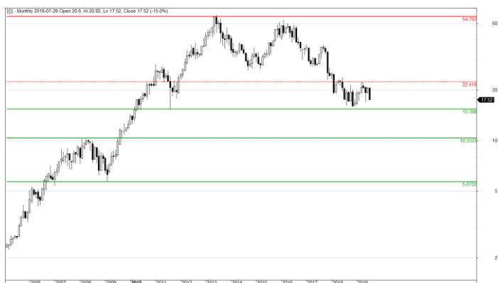
Wykres 2. Wykres miesięczny świecowy uwzględniający prawa z akcji.

Wczorajsze ześlizgnięcie się do tegorocznej podłogi nie wygląda zbyt optymistycznie dla akcjonariuszy. Jak na razie długoterminowe wsparcie zlokalizowane na wysokości 15.39 PLN liczone dla cen uwzględniających dywidendy, nie zostało jeszcze naruszone, jednakże trwająca od kilkunastu miesięcy konsolidacja przybrała postać struktury korekcyjnej, czyli układu łączącego dwa impulsy bessy. Nie można wykluczyć pojawienia się podwójnego dna, a tym samym zainicjowania zmiany trendu, jednakże trójfalowe zwwyżki z okresu VIII-X'18 r. oraz XI'18 r. - III'19 r. raczej wskazują na okres odpoczynku przed dalszymi spadkami. Na uwagę zasługuje kanał spadkowy, w ramach którego papier wciąż się porusza na południe i bez jego wiarygodnego wyłamania (weekly close > 23.6 PLN) outlook na Eurocash jest spadkowy. Z krótkoterminowego punktu widzenia na uwagę zasługuje pułap 19.54 PLN, którego wybicie do końca tego tygodnia mogłoby podziałać jako trigger do wyprowadzenia wzrostowej kontry.