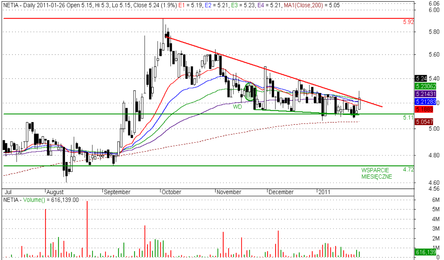
Rys. nr 1. NETIA Wykres dzienny świecowy.

Niniejsza publikacja jest publikacją handlową, prosimy o zapoznanie się z oświadczeniem umieszczonym na jej końcu.